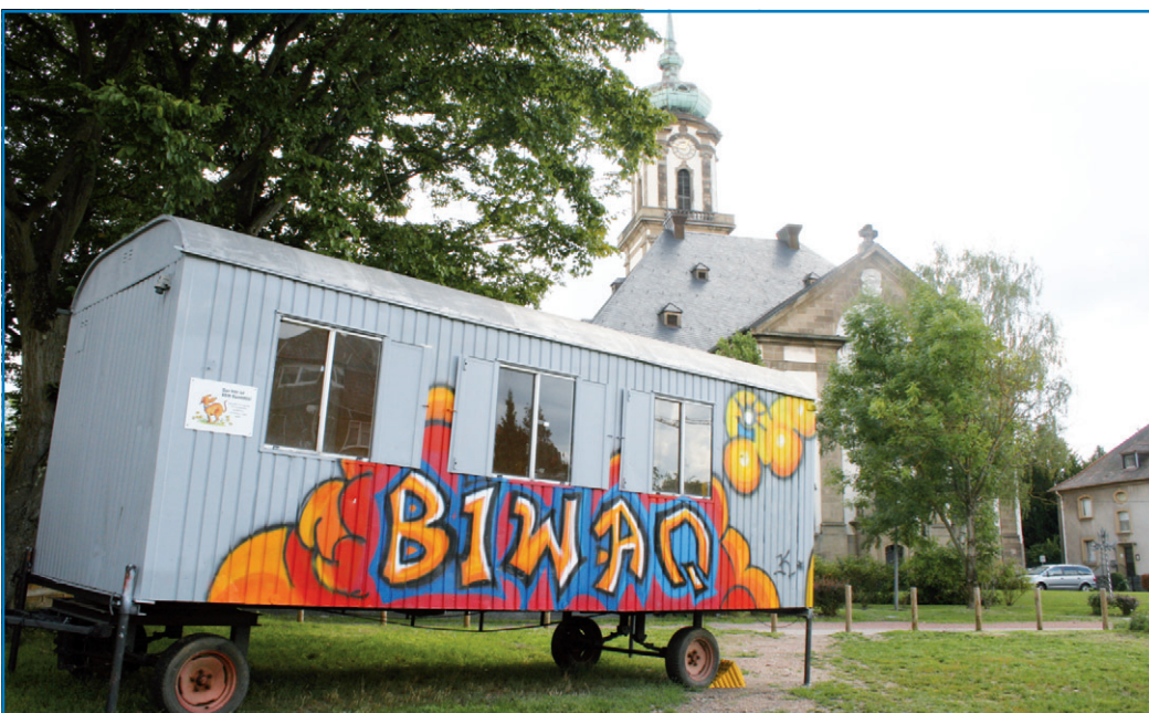
BIWAQ - Bauwagen vor der Versöhnungskirche

Eintrittskarten sind erhältlich bei allen bekannten Vorverkaufsstellen sowie bei der Tourist-Information Völklingen (Neuer Bahnhof, Rathausstraße 55, Völklingen). Informationen und Tickets auch online unter www.voelklinger-kulturmeile.de .