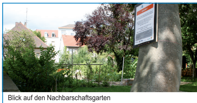
Blick auf den Nachbarschaftsgarten