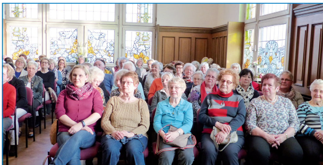
Besucherinnen und Besucher der Festveranstaltung im historischen Sitzungssaal des Alten Rathauses in Völklingen